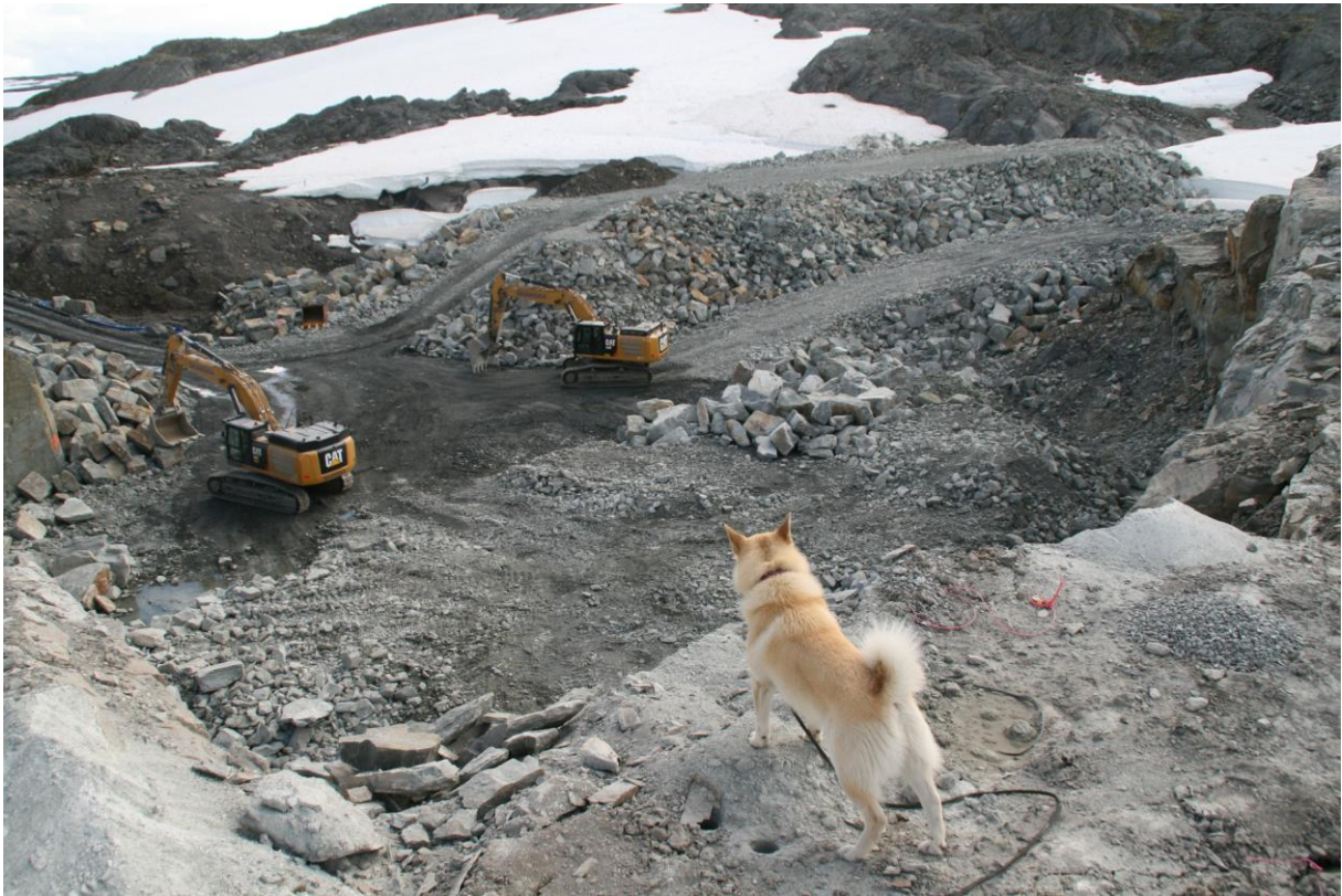
Buhund på kanten av den utsprengde skjeringa. Litt av den gamle strandlinja er intakt (bilete under).