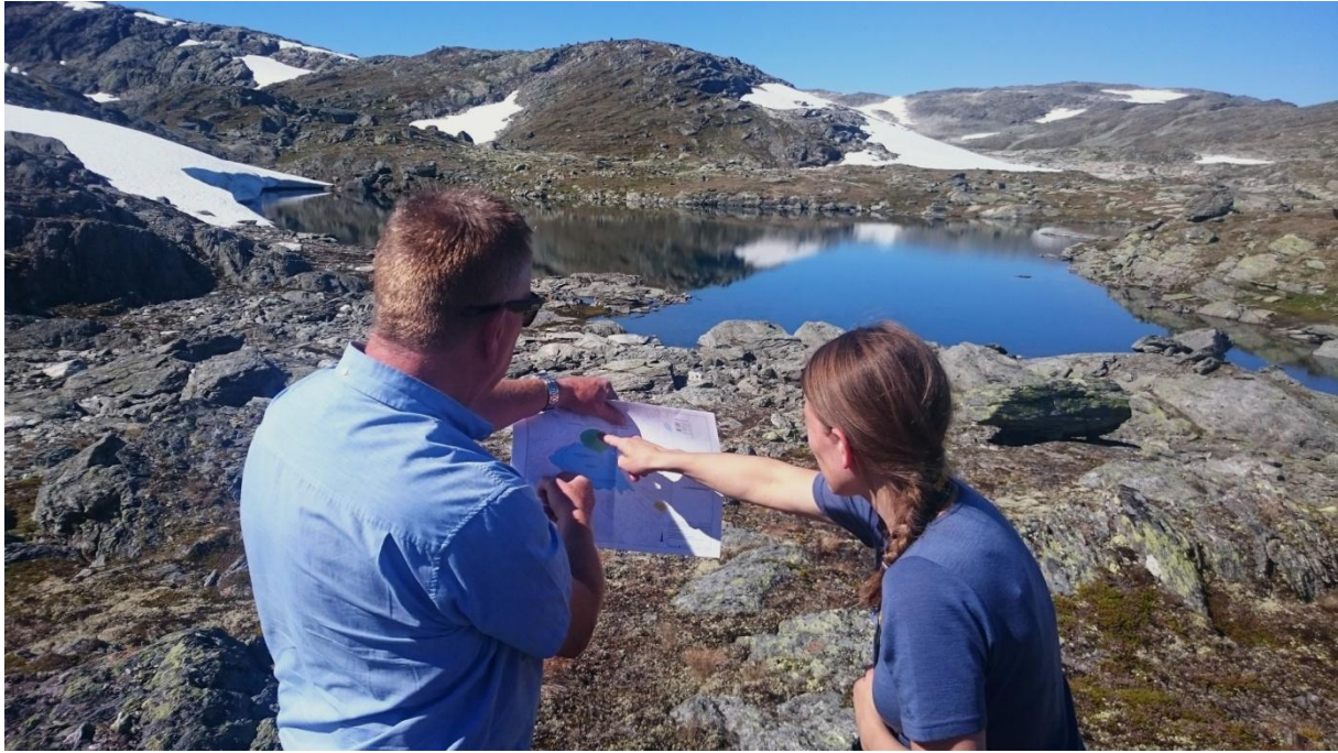
Lita tjørn ved ved Vargene 17. august 2016. Synfaring for å sjå på planlagt anleggsarbeid.