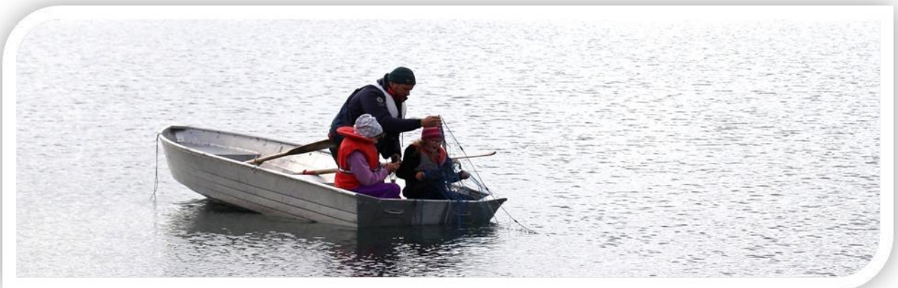
Fiske i Vargebotnvatnet

Til saman 81 skuleborn og 15 vaksne har vore med på desse fiskedagane i 2014.