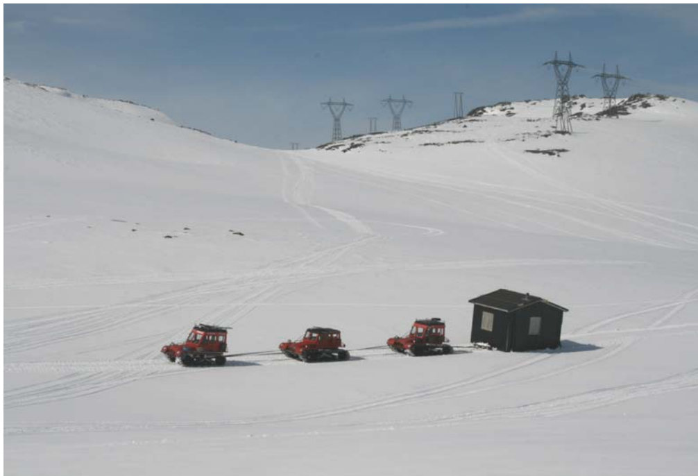
Frå flyttinga av Berdalsbu den 23. april 2008